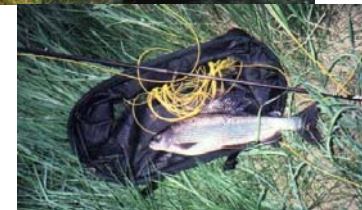
Dovre fjell i Norge Stalling fra Gelsaa

Majfluerne sværmer lige nu ! Det er tid til stalling og bækørred på tørflue. (prøv det det er sjovt)