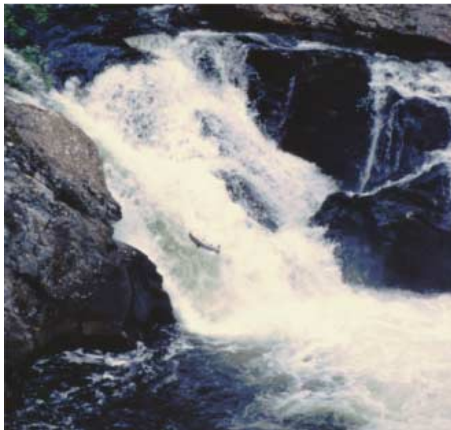
Figure 2 Den første store foss langt oppe i Gaula. Billedet viser en laks som forsøger at komme op over en Foss ved byen Ålen. I begyndelsen af juli står der hundrede at laks under det brusende vand, og venter på flom. (man må ikke fiske der) Foto: C. Nielsen - 2003