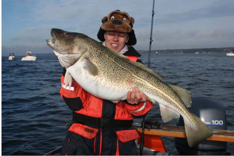
Torsk fra en af de gode dage

Vil du prøve noget nyt så tag med på disse ture efter torsk. Der vil blive bulefisket på Øresund fra småbåde, der fiskes fra to både med plads til 4 på hver båd. Det er ikke afslapper ture men rene buleture så husk varmt tøj og masser af kaffe/te.