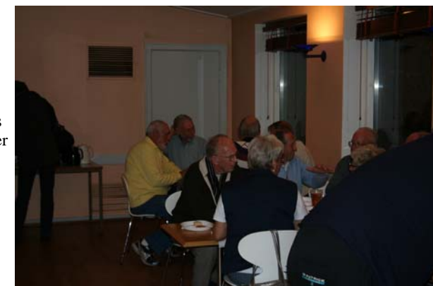
Der hygges og udveksles historier fra svundne tider