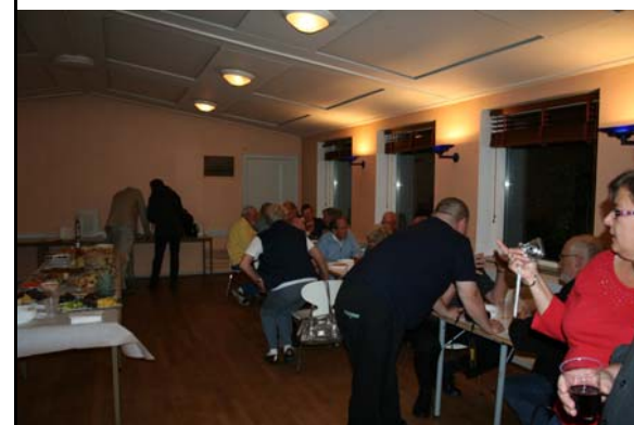
Der bliver set på gaver og klubbens gamle fotoalbum som var medbragt i anledning af jubilæet